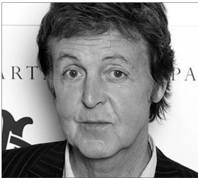
A sinistra l'ex Beatles Paul McCartney; a destra Jim Morrison, voce carismatica dei Doors, morto per eccesso di eccitanti e superalcolici